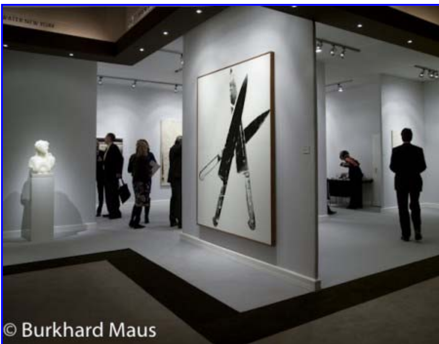
Sperone Westwater Gallery