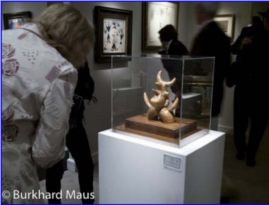
Landau Fine Art, Inc. - Joan Miró "Oiseau lunaire"

Auch die tefaf beschäftigte sich mit Japan – eher zufällig. Borzo modern & contemporary art zeigte "Tokyo Dreamer" von Koen Vermeule.