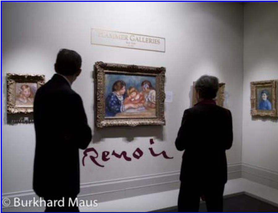
Hammer Galleries - Pierre Auguste Renoir "Le Leçon"