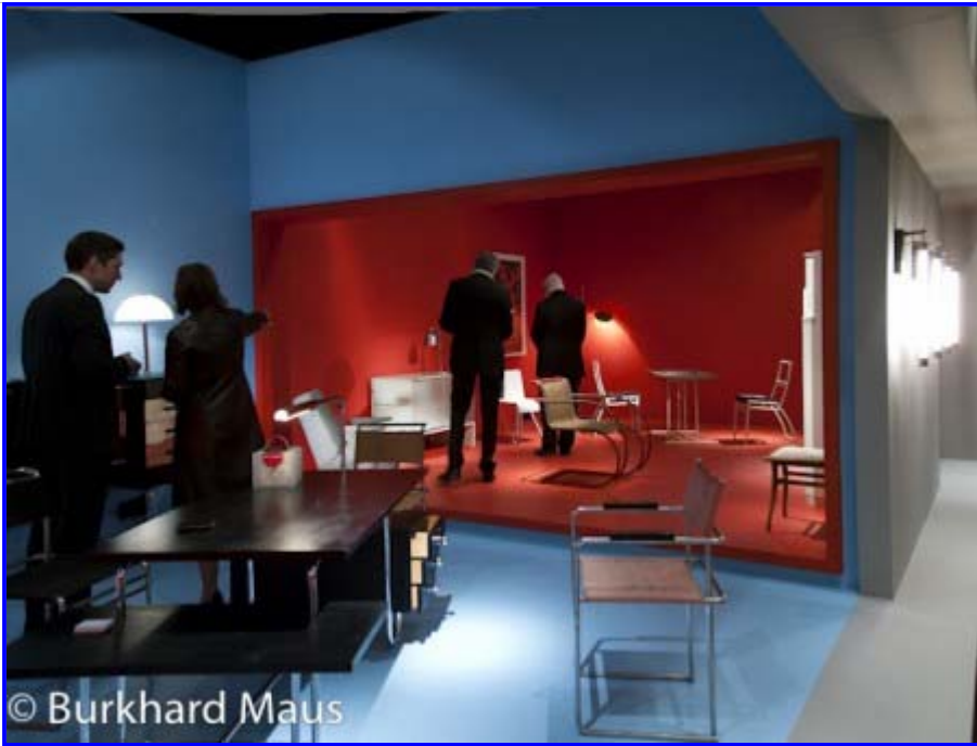
Galerie Ulrich Fiedler

Und gelohnt hat es sich auf jeden Fall – dann bis zum 16.März 2012